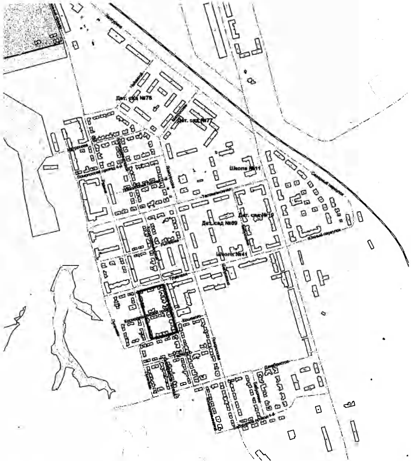
Схема расположения застроенной территории, подлежащей развитию